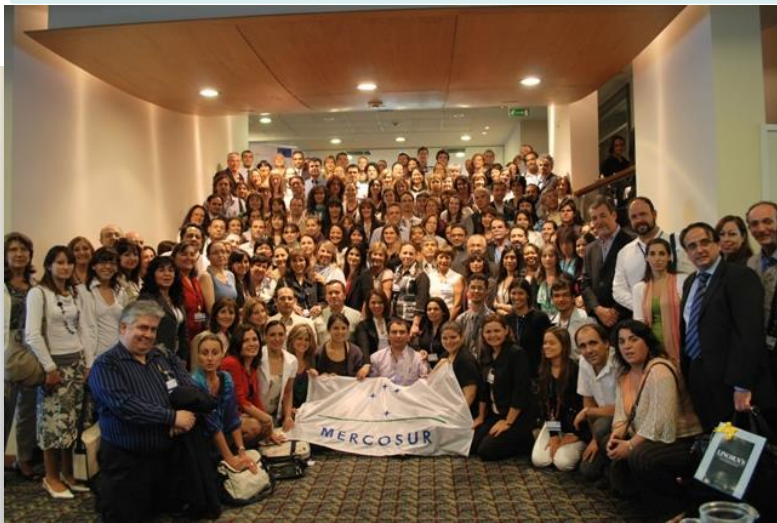
Montevideo Diciembre de 2010

Proyecto del Sector Educativo del MERCOSUR (SEM).