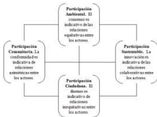
Figura 3. Fundamentos de Participación.

En efecto, al gobernanza de los recursos hídricos supone acuerdos entre comunidades que comparten recursos, usuarios y autoridades en torno a su precio unitario y consensos entre particulares que impliquen su extracción considerando la recarga de los acuíferos. En este sentido, los acuerdos emanan de los actores políticos o los agentes sociales, pero son las comunidades las que determinarán alguna dimensión participativa que convenga al interés público (Figura 3).