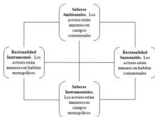
Figura 1. Fundamentos de Sustentabilidad.

agenda pública, iniciativas y demandas pueden derivarse de los estilos de vida austeros comunitario y las estrategias de cobro y subsidio que los gobiernos locales implementan para el abastecimiento regular de grupos marginados o excluidos (Figuras 1, 2 y 3).