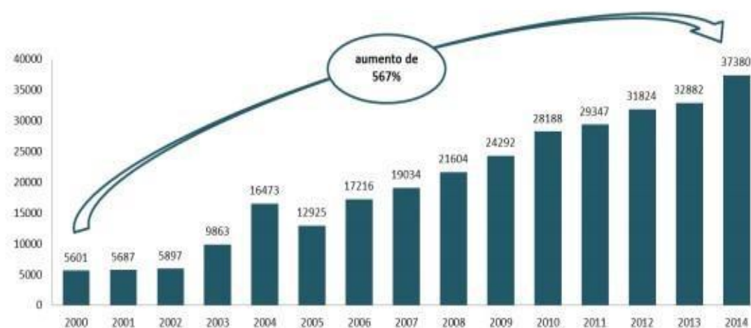
Figura 3. Evolução da população de mulheres no sistema penitenciário Brasil de 2000 a 2014