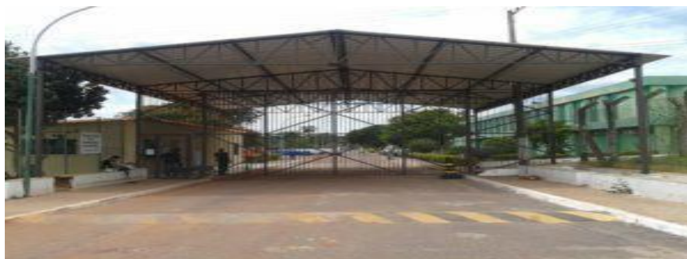
Figura 5. Imagem do PFDF